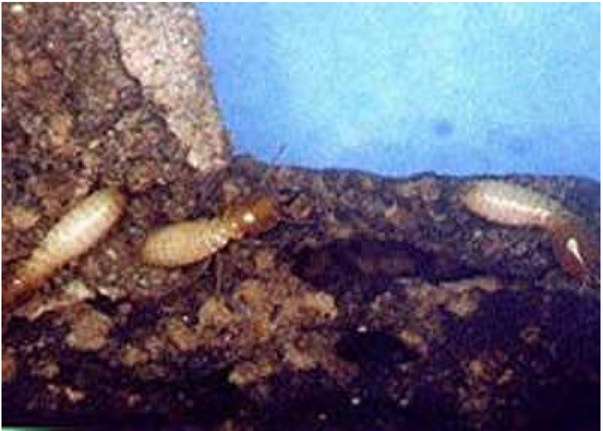
FIGURA 1.2 – Exemplo real de cupim frente ao seu dilema.

Segundo, o critério de otimização utilizado será o acoplamento entre as juntas do manipulador e neste caso, temos um sistema redundante quando ocorre falha de uma das juntas do manipulador de três juntas, e seu posicionamento é controlado pelas duas restantes. Nossa solução para o problema é baseada na formulação de redundância local, extensivamente estudada no contexto de cinemática inversa (nakamura). A principal contribuição deste trabalho é a extensão deste método usando as equações dinâmicas de manipuladores subatuados e a utilização do índice de acoplamento como um critério para a minimização do torque e da energia gasta pelo sistema durante o controle das juntas falhas.