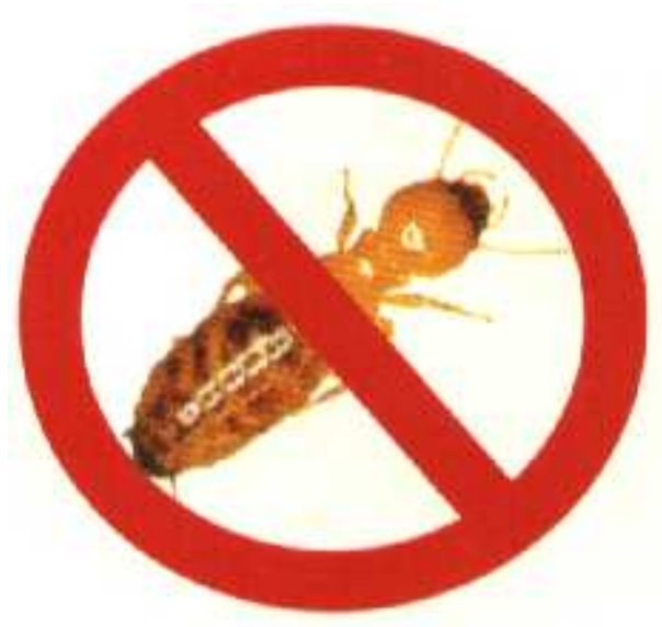
FIGURA 1.1 – Proibido estacionar cupins. Legenda grande, com o objetivo de demonstrar a indentação na lista de figuras.

Após a ocorrência de uma falha em um de seus atuadores, o manipulador torna-se um sistema subatuado. Um sistema também pode se tornar subatuado quando é projetado dessa maneira, ou quando o operador deliberadamente mantém um ou mais atuadores disponíveis inoperantes durante uma tarefa. Reduzindo o número de atuadores sem reduzir o número de graus de liberdade e ajustando-se o sistema de controle adequado, pode-se obter um mecanismo cujo consumo de energia é menor, mas cujas propriedades são mantidas (ARYSTIDES; MEDEIROS, 1995).