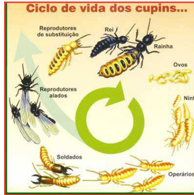
FIGURA A.1 – Uma figura que está no apêndice